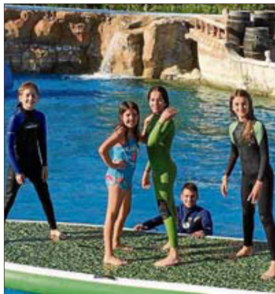
El paddle surf, una actividad nueva en el campus.

primera calidad los menores disfrutarán de un verano diferente, una oportunidad única para practicar deportes al aire libre y en un entorno inigualable. El campus de verano se desarrollará de lunes a