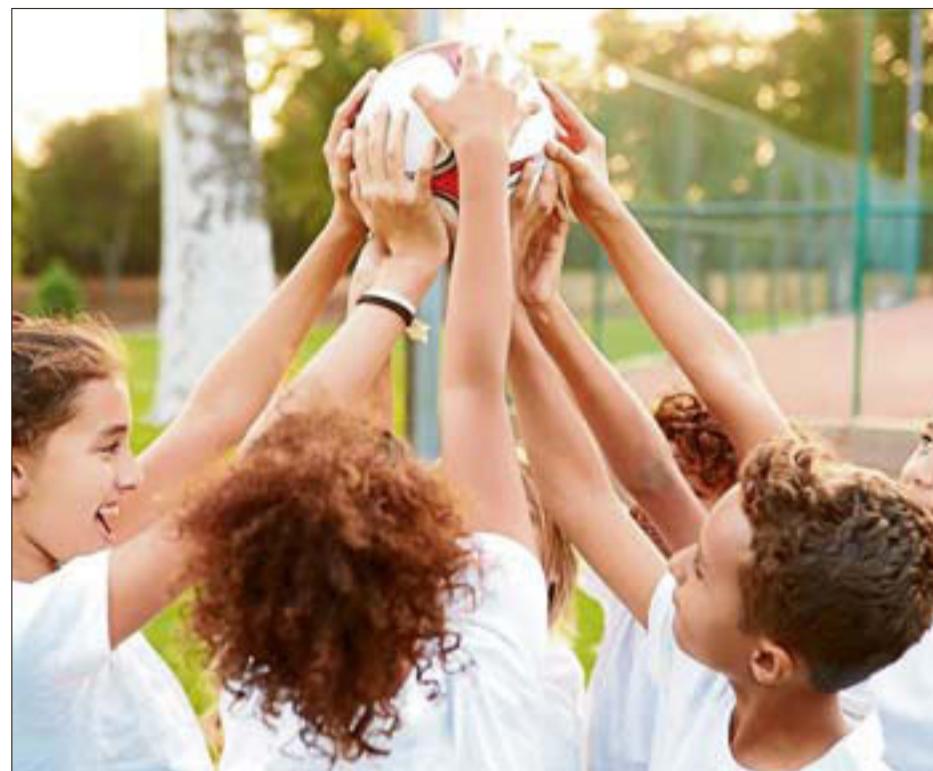
Los campamentos de Vals Sport, una oportunidad para hacer nuevos amigos. LA OPINIÓN