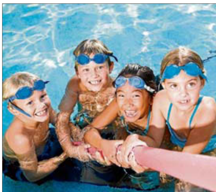
Actividades acuáticas para todos. LA OPINIÓN

Concluye cada período de campamento con una gran fiesta de clausura en la que se en-