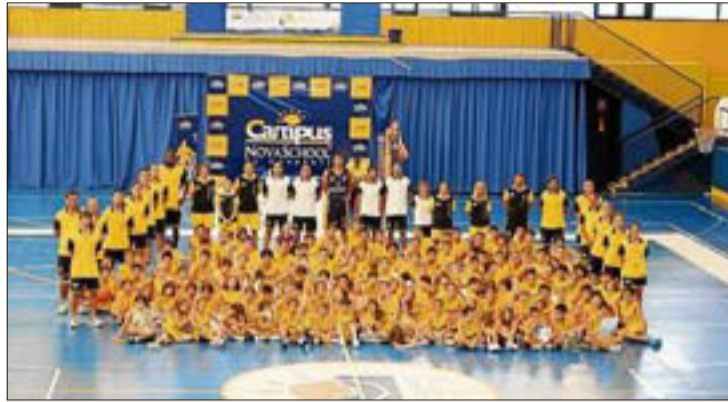
Foto de familia del campus de verano de la edición pasada.

■ Se acerca el final del curso escolar y pronto comenzarán las vacaciones de verano, y como cada año a las familias se les plantea la misma duda, ¿cuál es la mejor opción? Desde Novaschool lo ponemos fácil. Hemos organizado un total de 4 campus dirigidos a niños/as de diferentes edades, con disponibilidad de fechas y modalidades (interna y externa) y para todos los gustos, aunque nos centramos en dos grandes temáticas, campus en inglés y campus deportivos: