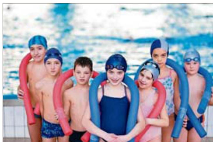
La natación, una de las mejores opciones para disfrutar del verano. L.O.