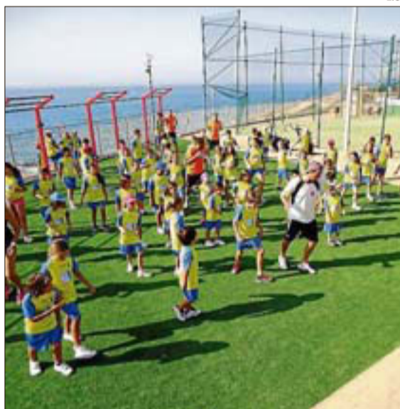
El deporte es uno de los ejes de las jornadas.

Bajo la dirección del prestigioso entrenador Reuf Dervic, ex-coordinador de Málaga CF, y su equipo de entrenadores del Elephant Sport Academy, los niños desarrollarán diversas habilidades y se plantearán nuevos retos gracias a la práctica de los distintos deportes. Su método educativo basado en la diversión y en la su-