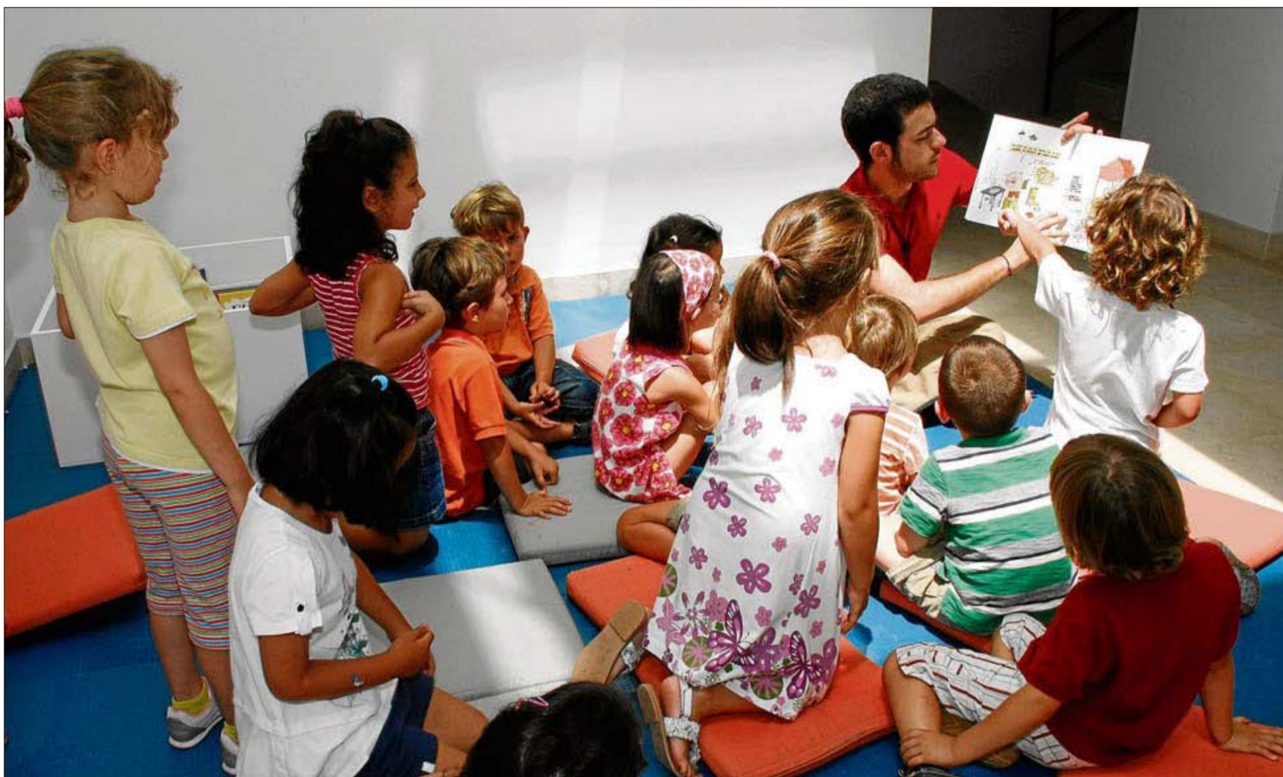
A los 3 o 4 años los niños pueden comenzar a ir a campamentos urbanos. LA OPINIÓN