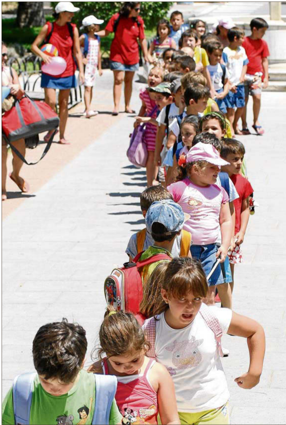
La asistencia a campamentos de verano es cada vez más habitual.

Más información: 619 008 726 / info@madaura.es