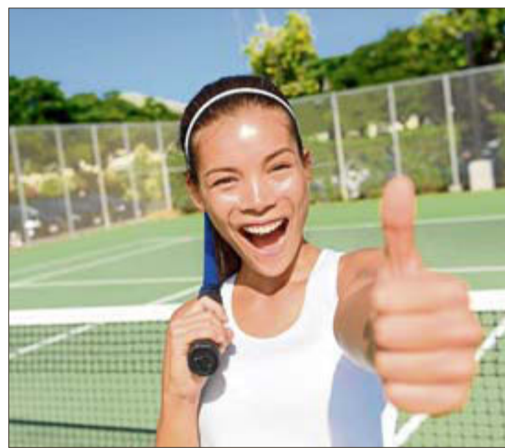
El tenis es otra de las actividades del campamento.

En definitiva, cuentan con todo lo necesario para que los alumnos pasen un verano inolvidable haciendo muchos amigos y disfrutando del deporte día a día. Más información e inscripciones en la recepción de nuestros cinco centros o en los teléfonos 952 003 034 - 952 622 262 www.vals-sport.com